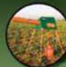
SCATTERBIRD MARK 3